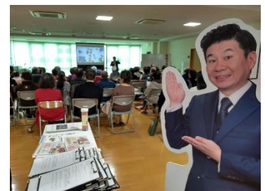
出張終活セミナー