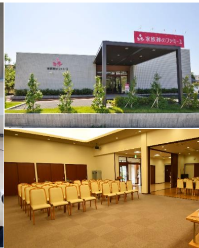
家族葬のファミリー 麻生田ホール