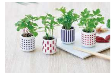
来場者特典イメージ

お葬式の準備や段取り、費用やコロナ渦での対応など、心配なことや不安なことを何でもご相談いただけます。来場者特典として「アニマルハンディモップ」と「トイレットロール」をプレゼント。さらに、ファミリーユ会員様および新規ご入会者様（入会費・年会費無料）には「おちよこで薬味栽培キット」を進呈いたします。