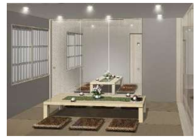
遺族控室イメージ

広瀬ホールは、足元に不安のあるご高齢の方でも移動がしやすい平屋建ての家族葬専用ホールです。外観はモノトーンを基調としたシンプルな意匠が特徴で、建物正面に施した植栽が周囲の景観に溶け込み、ご家族や参列者に落ち着きを与えてくれます。開放感のあるホール内は、引き戸によってレイアウトが変えられる造りになっており、プライバシーに配慮した過ごし方も可能です。