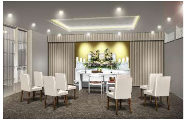
「家族葬のファミリー 広瀬ホール」外観・式場イメージ