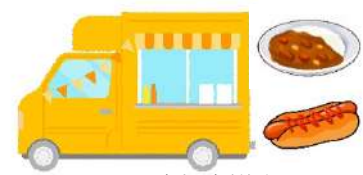
ファミーユの子ども食堂で無料提供（イメージ）