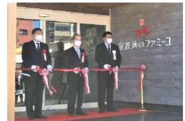
セレモニー（一昨年8/29とろくホール開店時）

楽しいダンスの発表会を開催。受講生のみなさんが日頃のレッスンの成果をお見せします。