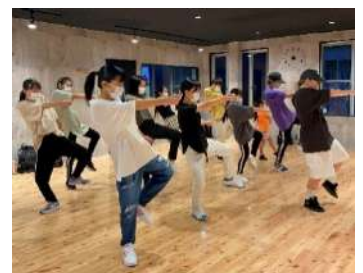
ハンキードリースタジオの受講生のみなさん