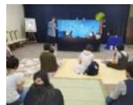
「うたのにぎょうげき」 昨年10/25 長嶺西ホール