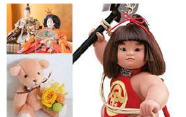
人形供養祭で寄せられる人形の数々（イメージ）