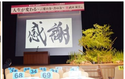
◆文化講演会 (みやそう会館／宮崎市柳丸町)