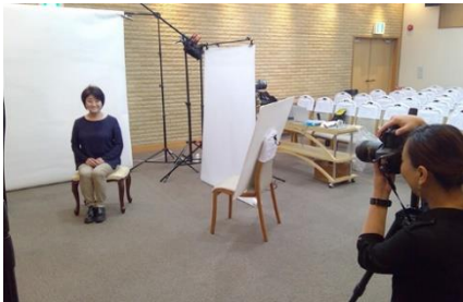
◆プロによる遺影用写真の撮影会 (清武加納ホール／宮崎市清武町)

生活者の方々に気軽に足を運んでいただける身近な存在をめざし、地域に寄り添いながら様々なイベントを継続的に開催しています。