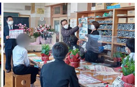
番外編：中学生対象の「社会人の声を聴く会」に参加（広瀬中学校／宮崎市佐土原町）