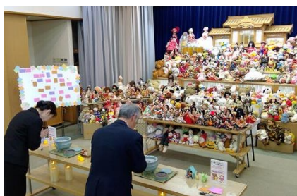
◆人形供養祭 (吉村ホール／宮崎市大王町)