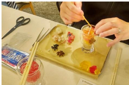
◆ジェルキャンドル教室 (住吉ホール／宮崎市島之内)