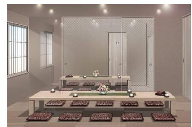
遺族控室イメージ

※新型コロナウイルス感染拡大防止のため、内容変更または中止となる場合がございます。