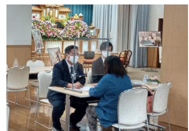
相談会の様子（2021年10月30日国富ホール）