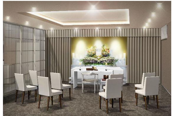
「家族葬のファミリーユ 本郷北方ホール」外観・内観イメージ