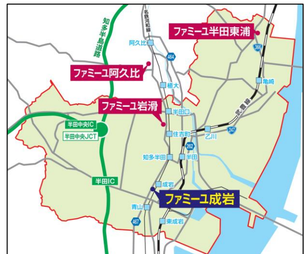
成岩ホールの出店により半田市全域をカバー

家族葬のニーズは、核家族化や高齢者の増加、さらには長引くコロナ禍によって全国的に需要が高まっていることもあり、市北部に位置する半田東浦ホールと、市中央部の岩滑ホール、さらには市南部の成岩ホールで市内全域をカバー。3 店のネットワークにより当社の掲げる“地域いちばんの家族葬”の輪を半田市に広げてまいります。