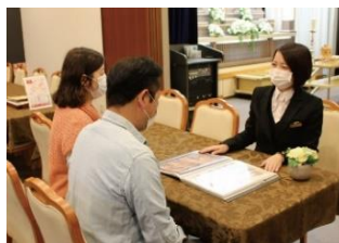
過去に開催した相談会の様子

相談会では、お葬式の準備や段取り、費用、コロナ禍での対応など、不安なことを気軽にご相談いただけます。