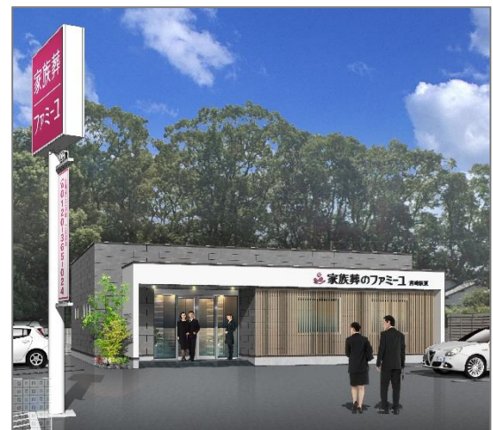
緑に映えるグレイッシュな外観