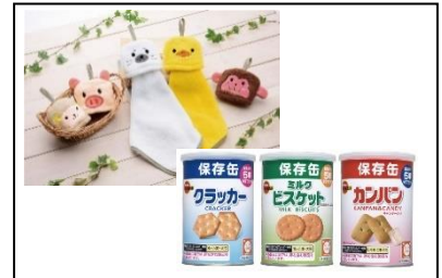
来場者特典イメージ