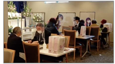
過去に開催した相談会の様子

※新型コロナウイルス感染拡大防止のため、内容変更または中止となる場合がございます。