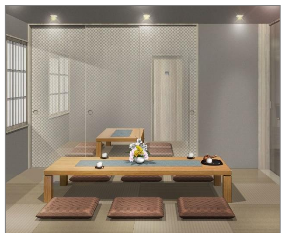
ゆったりとくつろげるスタイルの控室