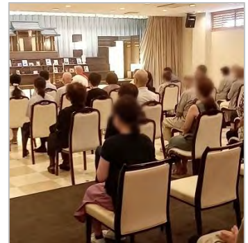
2021年の合同供養祭の様子 （8月5日ファミリー藤野ホール）

家族葬のファミリー北海道支社では、2019年から「合同供養祭」をスタート。家族の高齢化やコロナ禍で帰省が困難な方、お寺との付き合いのない方など、お盆の供養をしたくてもできないという声をお聞きし、どなたでもご参加できるイベントとして毎年開催しています。