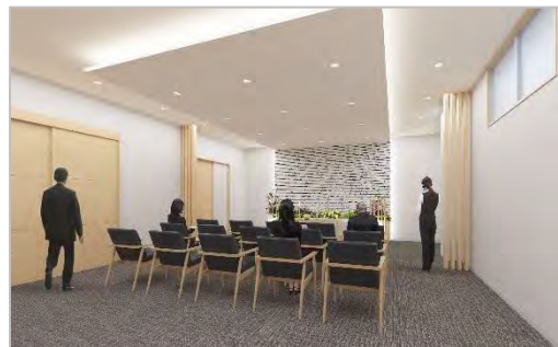
祭壇空間が控室と隣接している LDK 型のホール

核家族化と高齢者の増加、さらには長引くコロナ禍で全国規模でニーズが高まり、葬儀のスタンダードにもなりつつある「家族葬」は、北海道でも急速に普及しています。今回オープンする新琴似ホールは、2021 年 3 月にオープンした北 37 条東ホール以来、札幌市内で 19 店舗目となります。