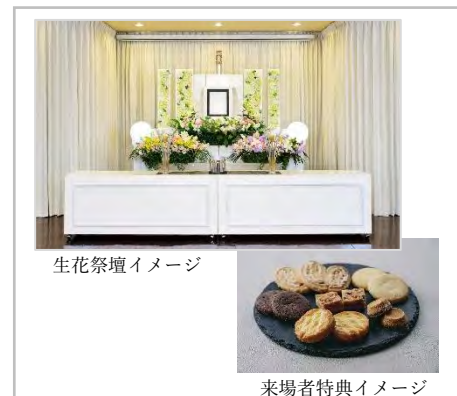
生花祭壇イメージ

来場者特典として、「クッキー詰め合わせ」をプレゼントいたします（一組につき一つ。無くなり次第終了）。