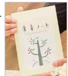
家族・友人へのメッセージやお葬式のことなど、10項目が書き残せる「未来ノート」

家族葬のファミリーでは、ご希望の方にオリジナルのエンディングノート「未来ノート」を無料で差し上げています。「これまでの人生の棚卸し」をしながら、「いつか訪れるその時」に残された家族が困ることのないよう、大切な事項を記録できます。チェックリスト形式にもなっているので、メモ感覚で終活が始められると好評です。