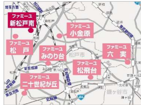
松戸市内に合計7店舗は、葬祭場で最多