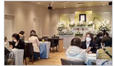
昨年12/2にオープンした家族葬のファミリー松飛台ホールでの相談会の様子

家族葬のファミリーは2022年12月、松戸市に2店舗をオープンし千葉県内に合計21ホールを展開するに至りました。2023年2月には同じ松戸市の秋山駅前にも新店オープンを抑えています。ご葬儀だけではなく、様々なイベントを通して松戸市の皆様を支援していきます。「家族葬のファミリー」がココにあってよかった、と感じていただきたいと思っています。