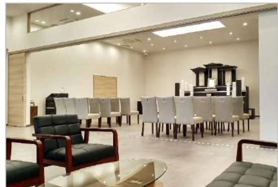
天井が高く開放感のある式場。全体的に落ち着いた色調で統一。

刈谷市内で3店舗目となる当ホールは、無電柱化された空の広い街並みが特徴の広小路地区に位置しています。