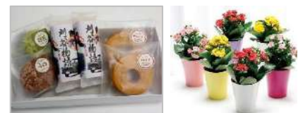
刈谷市民に愛される「常川屋」の焼き菓子セットと季節の鉢植え花をプレゼント

2023年1月18日(水)・23日(月)・29日(日) ※友引 各日 10:00～16:00 (予約不要・参加無料)