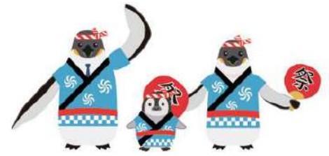
刈谷市のご当地ファミリーくんファミリー ※ファミリーくんは、「家族葬のファミリー」の マスコットキャラクターです

夏には「万燈（まんど）祭」で盛り上がる刈谷市。この「家族葬のファミリー 刈谷市駅前ホール」の前も、迫力ある大万燈が通ります。昨年の万燈祭では、ファミリースタッフもうちわ配りで参加しました。