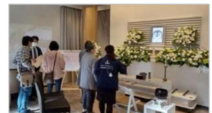
昨年12/1にオープンした「家族葬のファミリー 安城中央ホール」で開催した内覧会の様子