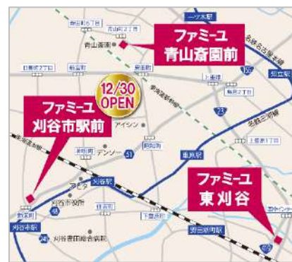
これまで空白エリアだったJR東海道線の南側を埋める3店舗目