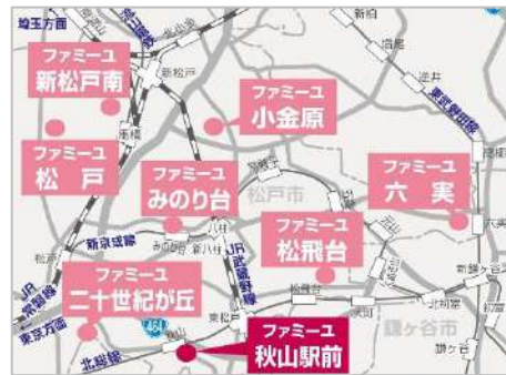
家族葬のファミリー 松戸市内 MAP