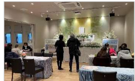
1月の「家族葬のファミリー新松戸南」のオープニング見学・相談会には計350組が参加

来場者には特典として、ゴディバ「クッキーアソートメント」をプレゼント。さらに、当日無料会員登録をさせていただいた方には、「QUOカード（1,000円分）」を進呈します（一組につき一セット）。