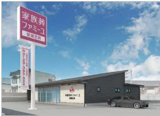
安城市東部を走る名鉄西尾線「碧海古井駅」から徒歩 4 分