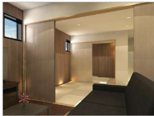
自宅で過ごしているようにくつろげる遺族控室

愛知県内直営 18 店舗目となるこのホールは、2022 年 12 月にオープンした「家族葬のファミリー 安城中央ホール」に続く、安城市 2 号店です。名鉄西尾線「碧海古井駅」から徒歩 4 分の、安城市総合斎苑にも近く利便性の高い立地で、片流れ形状の屋根とグレーのコントラストが効いた外観が特徴です。開放感を重視し、大切な方との最後の時間をリラックスして過ごせるよう設計しています。