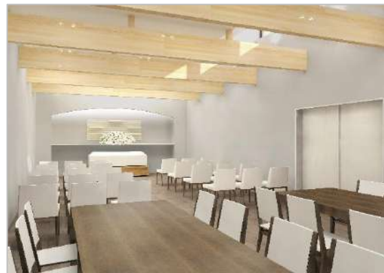
天井が高く洗練された雰囲気のある式場（イメージ）