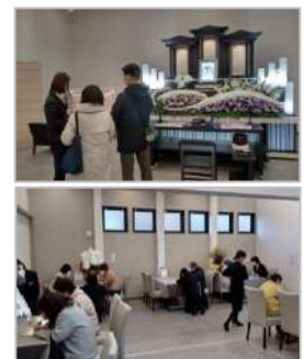
家族葬のファミリー 刈谷市駅前ホールで開催した見学会の様子

また、家族葬のファミリー会員特典として、25 日（土）～27 日（月）の 3 日間に限り、東海市のプライベートサロン「Rassembleur（ラソンブレ）」のハンドケアサービスも無料提供します（1 回 10 分・先着順/当日会員登録された方も対象）。