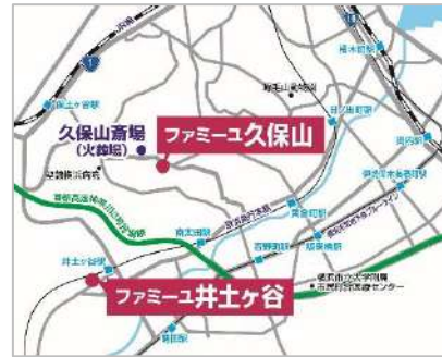
近隣の「ファミリーユク保山」も、昨年新装開店したばかり