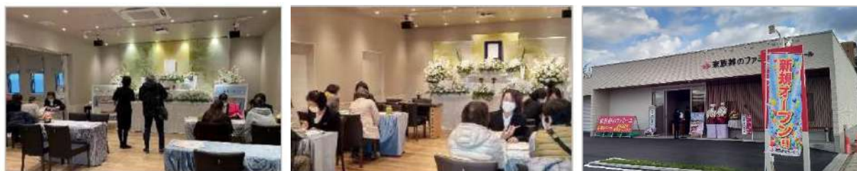
過去に開催されたオープニング見学会の様子