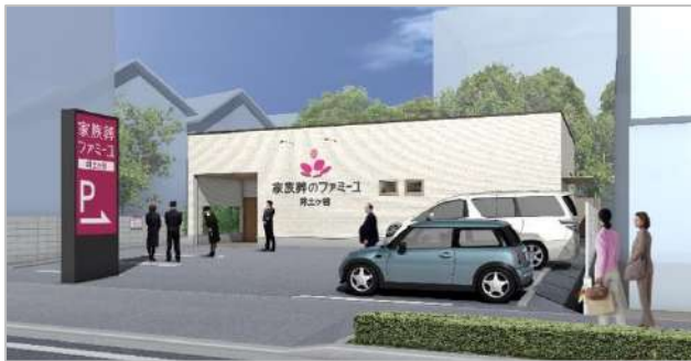
京浜急行本線「井土ヶ谷駅」南口から徒歩 5 分の立地は利便性大

株式会社きずなホールディングス（本社：東京都港区、代表取締役社長 兼 グループ CEO：中道 康彰、東証上場 7086）グループの中核事業会社である株式会社家族葬のファミリー（本社：東京都港区、代表取締役：中道 康彰）は、グループ累計 125 店舗目となる家族葬専用ホール「家族葬のファミリー 井土ヶ谷ホール（所在地：神奈川県横浜市）」を 2023 年 4 月 3 日（月）にオープンします。