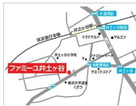
「井土ヶ谷駅」から徒歩5分