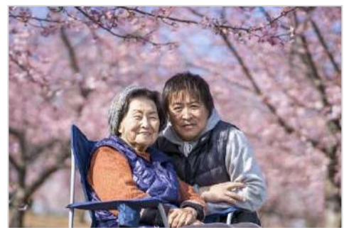
第2回(2022年)入賞作品「母とお花見」