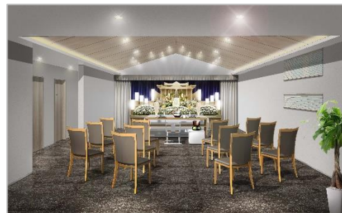
間接照明を多用し落ち着いた過ごせる式場（イメージ）

家族葬のファミリー 1 号店は、2001 年に宮崎市で誕生しました。県内 30 店舗目となる「家族葬のファミリー 高鍋ホール」は、その店舗網では最北地となる児湯郡高鍋町に立地します。宮崎市から国道 10 号線で繋がり、既存の佐土原ホール（2002 年開業）・新富ホール（同 2022 年）とともに同じ沿道に位置する新ホールで、ますます高まる家族葬のニーズに対応します。