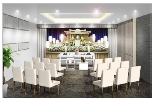
会葬人数により柔軟な式場設計が可能（式場イメージ）

超高齢化や新型コロナウイルス感染症拡大を経て令和時代の主流となった家族葬は、当社のルーツである“総合葬祭みやそう”が宮崎市に開設した「ファミリー大塚ホール」が始まりです。翌2001年には名称を「家族葬のファミリー大塚ホール」に変更し、家族葬を日本で初めてブランド化。以降、宮崎市内ならびに市近郊に30店舗の直営ホールを展開してきました。