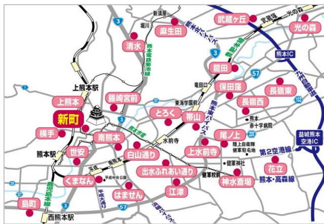
熊本市内のファミリーホールは26か所で展開

このたびオープンする新ホールは、熊本城築城時に整備された城下町である中央区新町に位置します。熊本地震後、このエリアは熊本城復興と共に公共インフラ開発も進み、新旧が共存する風情のある街となりました。ホール前には路面電車が走り、車も人も行き交う場所ですが、ホール内は家族空間と儀式空間をL字に沿って配置し、プライベート性を高めました。歴史のある城下町の雰囲気にも溶け込むよう、ホール外観は落ち着いたブラウトーンとし、重厚感をもたせました。