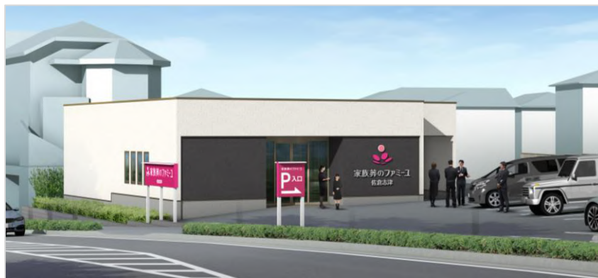
閑静な住宅街にも調和するシンプルなデザインのホール外観（イメージ）